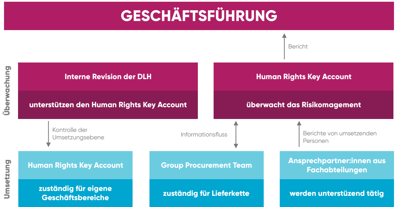
Organigramm Risikomanagement Eurowings GmbH

Die Eurowings GmbH hat ein Risikomanagement eingerichtet mit dem Ziel, menschenrechts- und umweltbezogene Risiken und Rechtsgutsverletzungen entlang der Lieferkette zu erkennen und zu verhindern oder zu beenden.